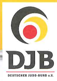
Judo-Verband Schleswig-Holstein e.V. Cordula Schwarten, 1. Vorsitzende